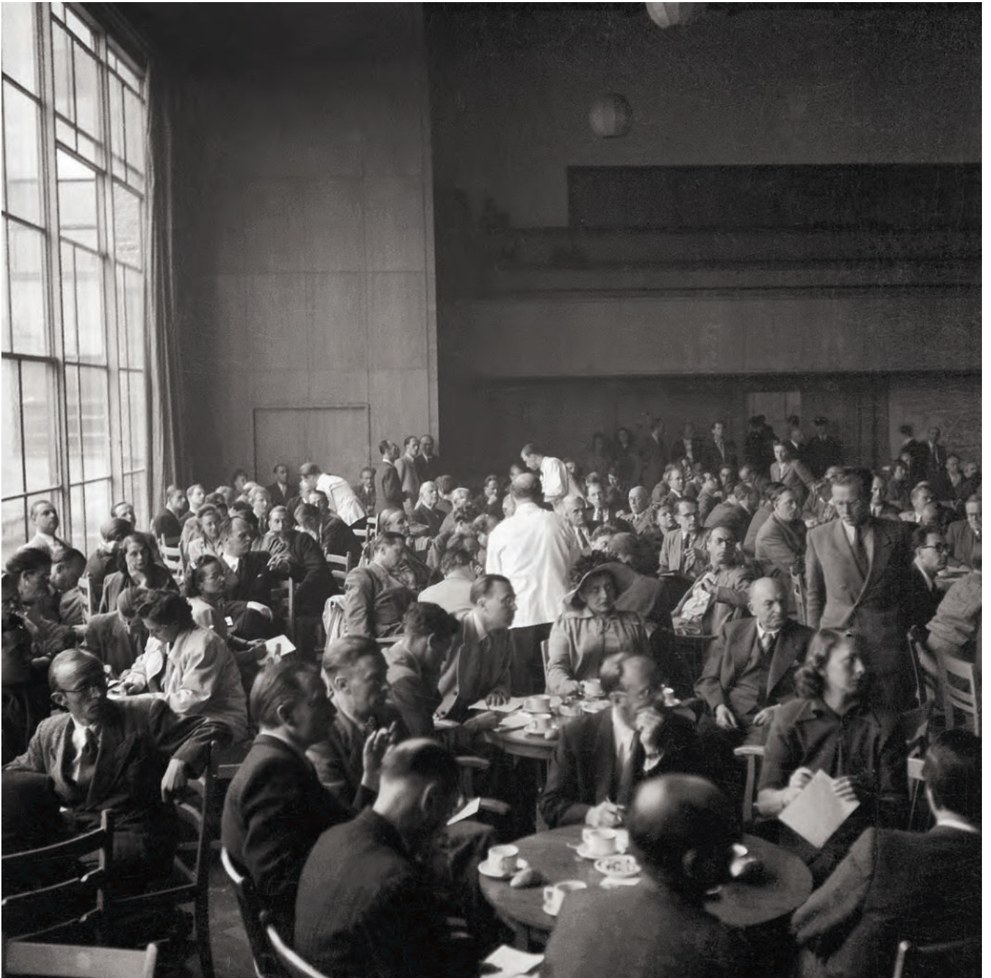
Kaffeetafel in der Aula der Pädagogischen Akademie.