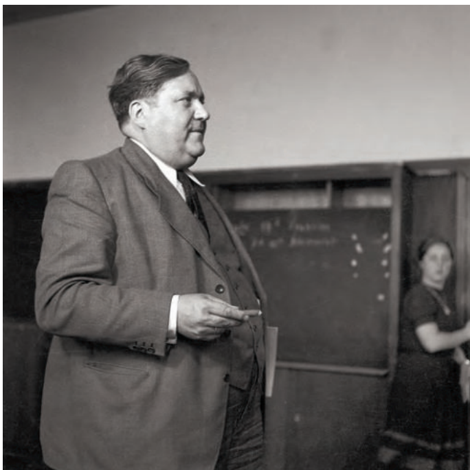
Carlo Schmid (SPD), Justizminister des Landes Württemberg-Hohenzollern, Spezialist für Verfassungsfragen und Vorsitzender des Hauptausschusses.