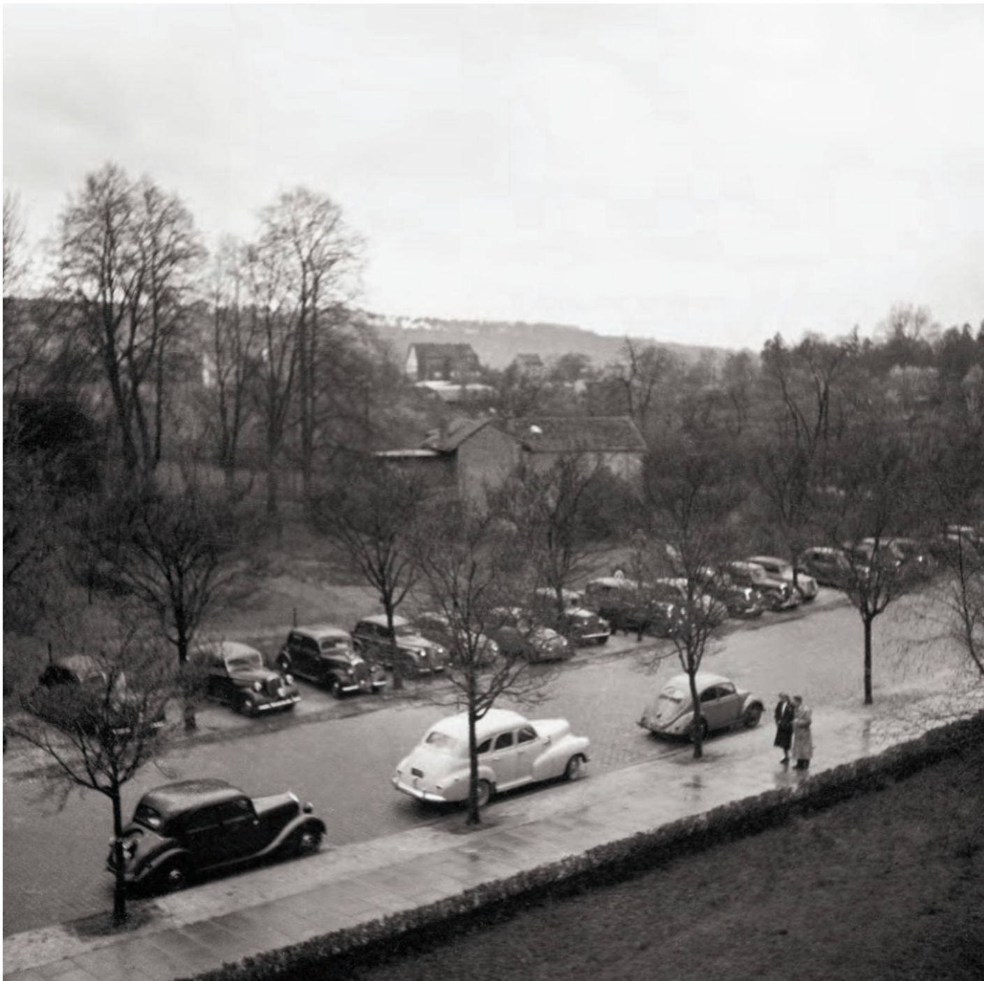
An der Görresstraße vor der Pädagogischen Akademie parken Dienstfahrzeuge.