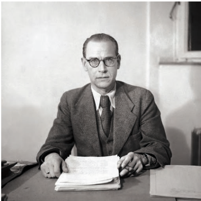
Georg August Zinn (SPD), Justizminister und später einer der prägenden Ministerpräsidenten des Landes Hessen.